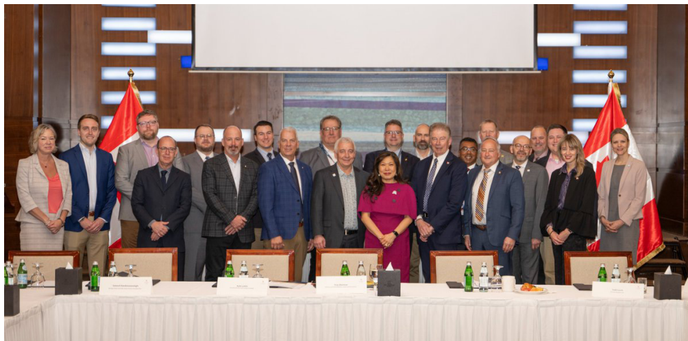
La 13e Conférence ministérielle (MC13) de l'Organisation mondiale du commerce

La 13 e Conférence ministérielle (MC13) de l'Organisation mondiale du commerce (OMC) a eu lieu du 26 février au 2 mars 2024 à Abu Dhabi, aux Émirats arabes unis. Des représentants des cinq offices nationaux de gestion de l'offre (ÉDC, PPC, POC, POIC et PLC) ont assisté à la 13 e conférence ministérielle (MC13) afin de suivre les négociations agricoles de l'OMC.