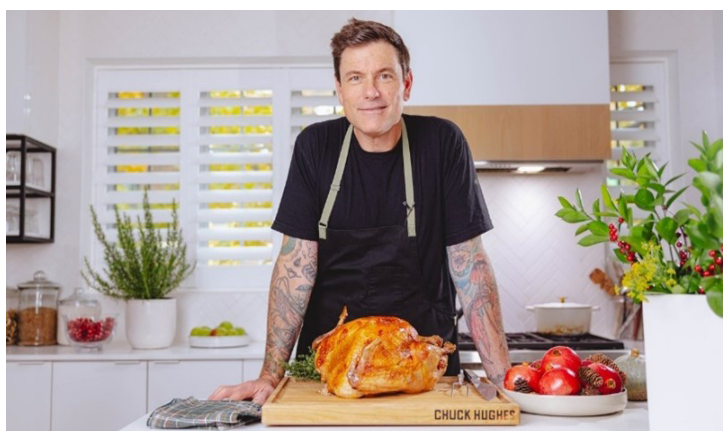
Chef Chuck Hughes

Huit récipiendaires ont remporté un Prix Dindons et une bourse de 2 500 $ pour soutenir leurs efforts pendant les Fêtes. Les Prix Dindons sont appuyés par le célèbre chef Chuck Hughes, qui a fait équipe avec Pensez Dindon MC /Think Turkey TM pour lancer le programme, en plus de figurer dans la vidéo de lancement.